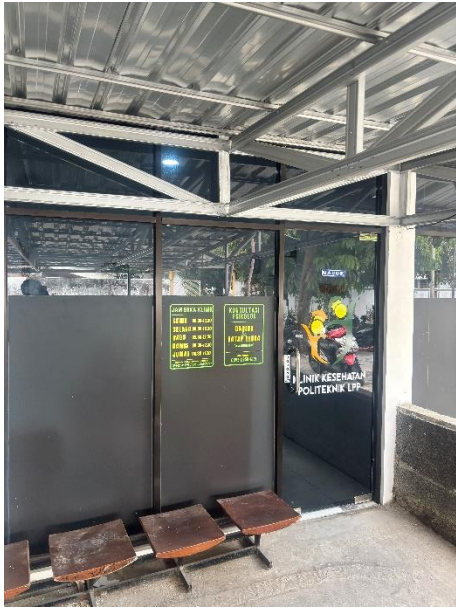
Poliklinik Dan Health Care

Tersedianya fasilitas umum yang lengkap dan representatif, meliputi koperasi, poliklinik, kantin, tempat ibadah, layanan kesehatan (health care), serta area parkir, guna menunjang kenyamanan dan kebutuhan seluruh civitas.