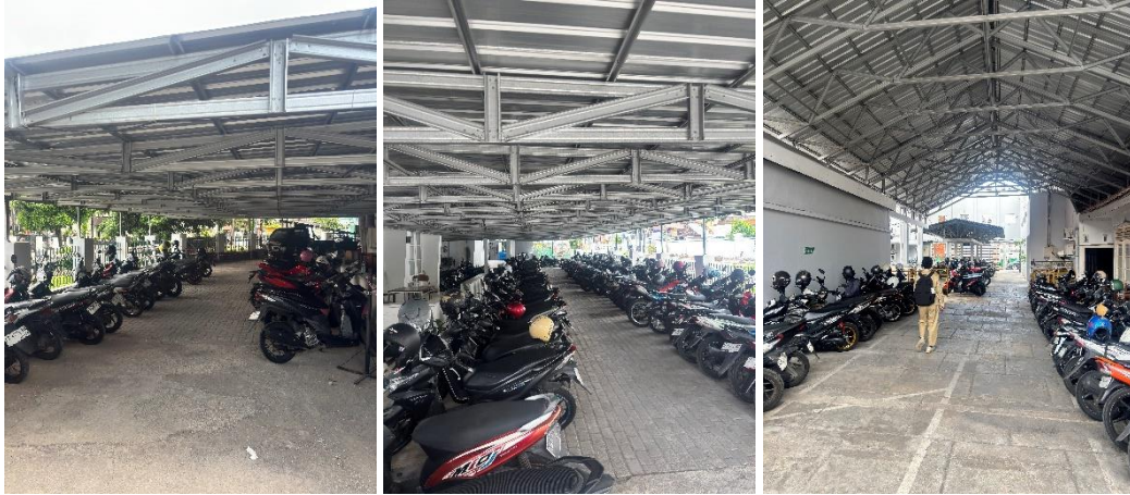
Area Parkir Dosen, Karyawan, dan Mahasiswa