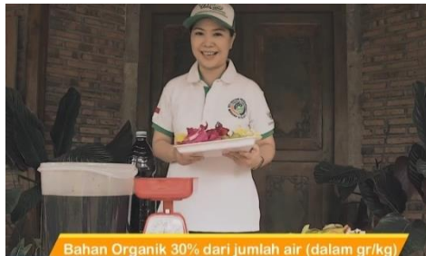
Gambar 3. Contoh materi video

Sharing session ini kemudian menjadi lebih menarik penyampaian materinya karena disajikan tidak hanya menggunakan presentasi powerpoint , akan tetapi juga video terkait contoh prosedur pembuatan eco enzyme . Selain itu, sesi tanya jawab juga dibuka untuk bisa membantu pemahaman para peserta atau sekedar berbagi pengalaman terkait masalah yang para peserta hadapi. Harapannya, penggunaan multiple media ini bisa menutup kelemahan dari metode kegiatan yang masih belum bisa dilakukan secara luar jaringan.