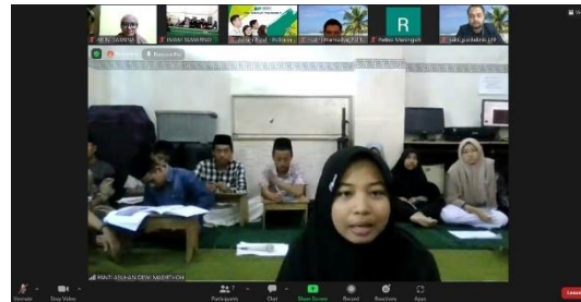
Gambar 4. Sesi Tanya Jawab

D. HASIL PELAKSANAAN PENGABDIAN KEPADA MASYARAKAT DAN LUARAN YANG DICAPAI: Tuliskan secara ringkas hasil pelaksanaan PkM yang telah dicapai sesuai tahun pelaksanaan PkM. Penyajian dapat berupa data, hasil analisis, dan capaian luaran (wajib dan atau tambahan). Seluruh hasil atau capaian yang dilaporkan harus berkaitan dengan tahapan pelaksanaan pengabdian sebagaimana direncanakan pada proposal. Penyajian data dapat berupa gambar, tabel, grafik, dan sejenisnya, serta analisis didukung dengan sumber pustaka primer yang relevan dan terkini. Tuliskan jenis, identitas dan status ketercapaian setiap luaran wajib dan luaran tambahan (jika ada) yang dijanjikan pada tahun pelaksanaan penelitian. Jenis luaran dapat berupa publikasi, perolehan kekayaan intelektual, hasil pengujian atau luaran lainnya yang telah dijanjikan pada proposal. Uraian status luaran harus didukung dengan bukti kemajuan ketercapaian luaran sesuai dengan luaran yang dijanjikan.