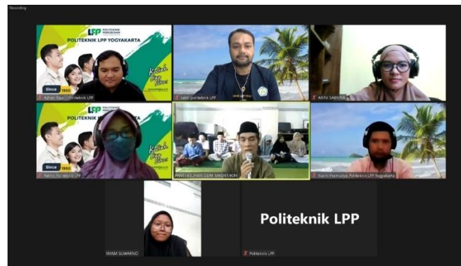
Gambar 1. Sambutan pihak Panti Dewi Masyithoh Pemalang